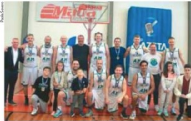
Competição se tornou tradicional e organizadores fazem planos para a próxima edição

Para Cruxen, o evento é uma congregação de jogadores e suas famílias. “Esse é um dos intuitos do Encontro Master, reencontrar o pessoal, os ex-atletas, e trazer os seus familiares para um final de semana bonito com jogos. Deu tudo certo e já vamos trabalhar para o próximo ano”, destacou. A realização é da Gazeta Grupo de Comunicações , com apoio de Colégio Mauá e Germani Alimentos e promoção da Rádio Gazeta FM 107,9 .