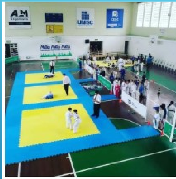
Evento na sede do clube Abril/2021